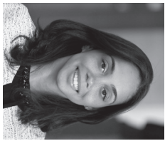
Asambleísta Latoya Joyner

Estimados amigos: Al terminar la temporada escolar en el verano, podemos motivar a nuestros niños a continuar aprendiendo a través de la lectura. ¡Leer es divertido! Los libros pueden sumergir a los niños en mundos desconocidos, personajes nuevos y narrativas emocionantes. Con este propósito, estoy auspiciando el Reto de Lecturas de Verano, en cooperación con la Biblioteca del Estado de Nueva York, para motivar a los niños a leer regularmente durante las vacaciones de verano.