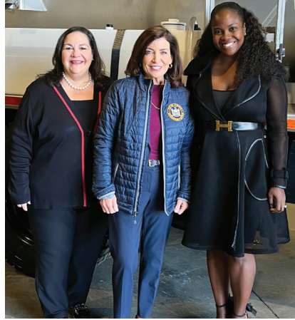
Manm Asanble Darling rejwenn Gouvènè Hochul pou Konferans sou reparasyon twou nan Long Island