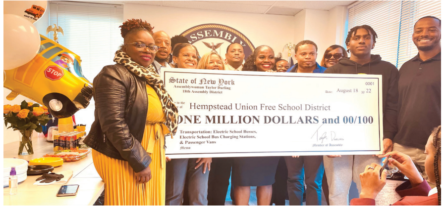
Manm Asanble Darling prezante Konsèy Lekòl Hempstead la ak chèk 1 milyon dola pou biz lekòl