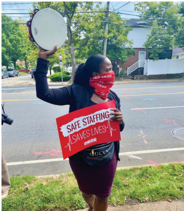
Mann Asanble Darling pwotekste ak Nelson Mandela pandan COVID la pou mande afektasyon pèsònèl sekirite pou enfimiyè yo