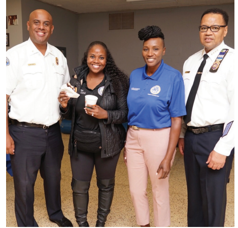
Manm Asanble Darling rejwenn Chèf Polis Hempstead yo Warner ak Johnson pou Kafè ak yon polisye nan Pak Kennedy

New York State Assembly, Albany, New York 12248