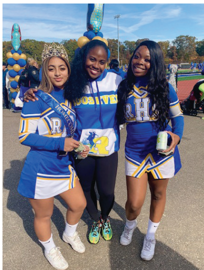
Mann Asanble Darling ap mache ak Ponn ponn girl Roosevelt yo nan defile retwouway la