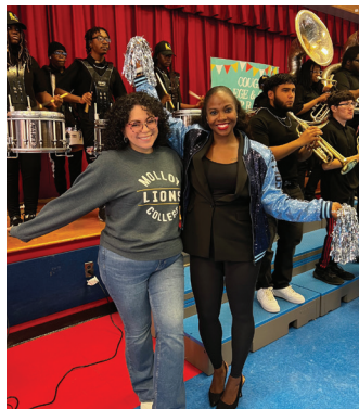
Manm Asanble Darling ap selebre Jounen Inivèsite a nan California Avenue School nan Uniondale