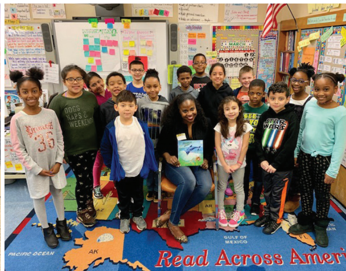
Mann Asanble Darling rejwenn etidyan yo pou Jounen Lektè se Lidè a