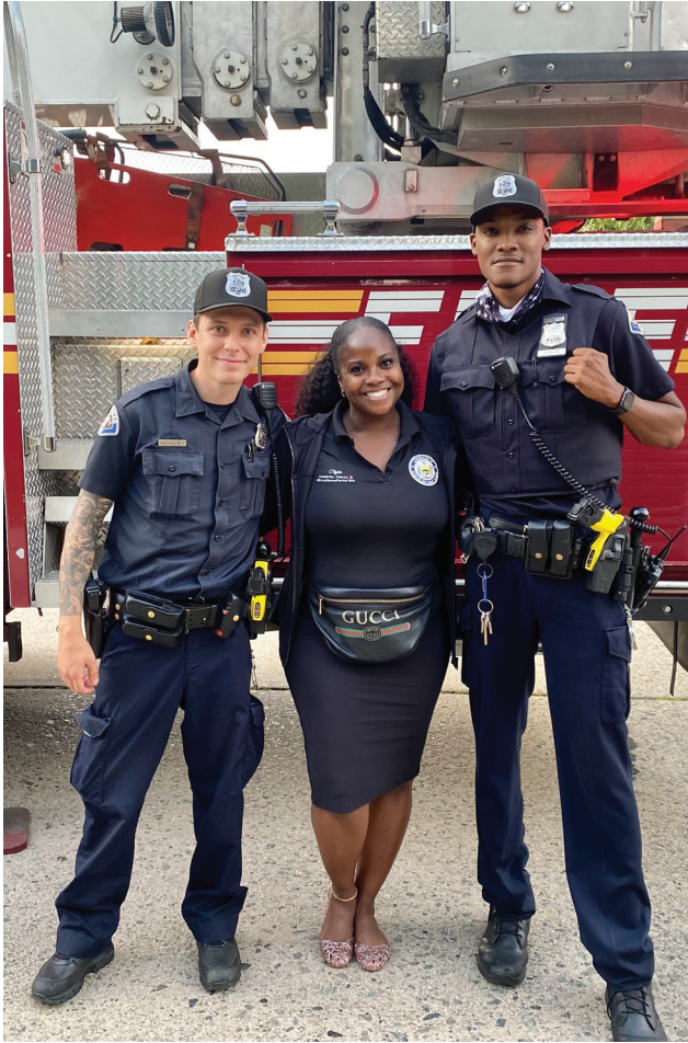
Manm Asanble Darling rejwenn ofisye polis Hempstead Hendry ak Green pou sware nasyonal la