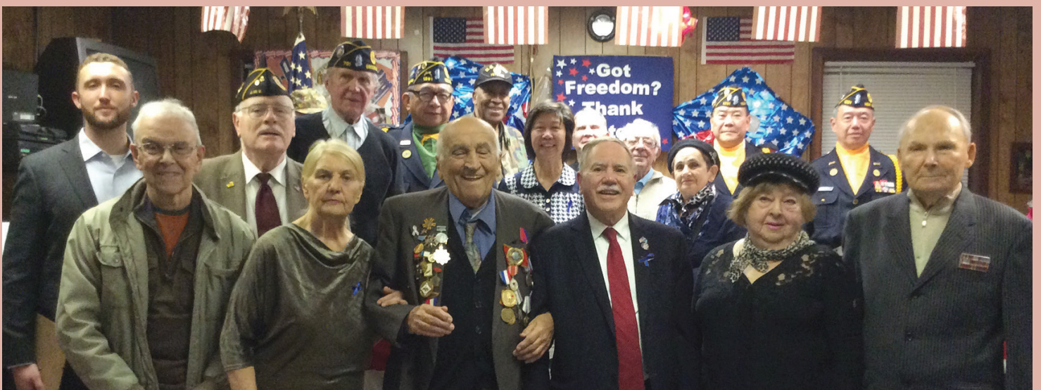
州眾議員寇頓向退伍軍人表示敬意，在他每年舉辦的退伍軍人日的慶典上對我們的退伍軍人表示感謝和讚賞。