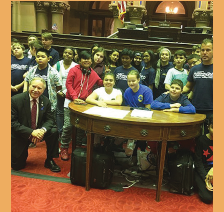
州眾議員寇頓在紐約州眾議院議會廳與第 303 中學的學生繼續為保留住專業高中入學考試而抗爭。

實現多元化的真正問題是，教育局未能在成績欠佳學區的低年級和中年級的學校中為非裔和拉丁裔資優孩子提供天賦班和專長班。在提供資優班的學區和不提供資優班的學區錄取進入專業高中的人數之間的差別就是最好的證明。教育局未能在這些學區為聰明孩子提供教育，這才是導致這些成績欠佳學區的孩子多數都沒有進入專業高中的原因。“許多家長感到教育局已經放棄了他們聰明的孩子，而是讓他們的孩子入讀私立學校、教會學校和特許學校，”州眾議員寇頓說。