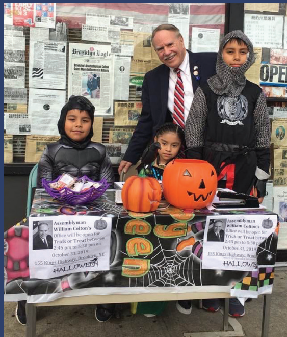
Депутат Ассамблеи Колтон праздновал Хэллоуин и раздавал сладости возле своего окружного офиса.

Community Office, 155 Kings Highway, Brooklyn, NY 11223