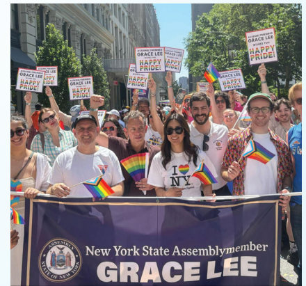
Celebrando el Orgullo LGBTQIA+ en la Marcha del Orgullo de 2025.