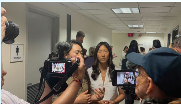
Acompañamos a personas al tribunal de inmigración, presenciando la violación del debido proceso por parte de agentes enmascarados de ICE en 26 Federal Plaza.