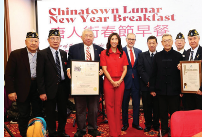
American Legion Lt. B.R. Kimlau Memorial Post.