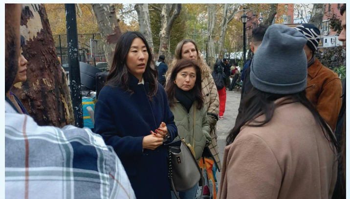
Nos unimos a la SDR Park Alliance y a la CB3 para un recorrido de seguridad en el Parque Sara D. Roosevelt con el Comisionado de Parques y la Policía de Nueva York.