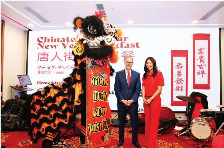
Celebrando el Año de la Serpiente y el primer año de un día festivo estatal en las escuelas públicas por el Año Nuevo Lunar.