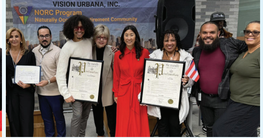
Vision Urbana, Grand Street Settlement, Tareake Dorill y Casa Adela