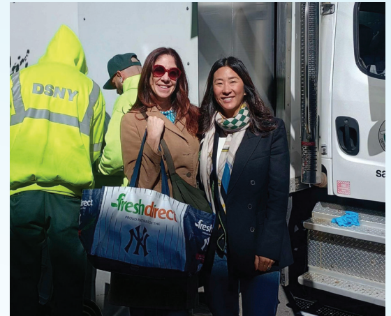
Organizando un evento gratuito de trituración de papeles en el LES

🚧 Cuando un negocio local bloqueó repetidamente la acera con materiales de construcción, trabajamos con el Departamento de Sanidad para remover los materiales y mantener la acera despejada para los peatones .