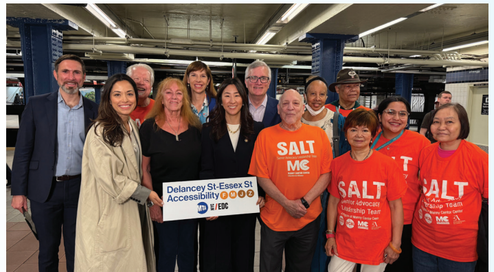
Abogando con defensores de la comunidad para los nuevos ascensores accesibles en la estación Delancey-Essex.