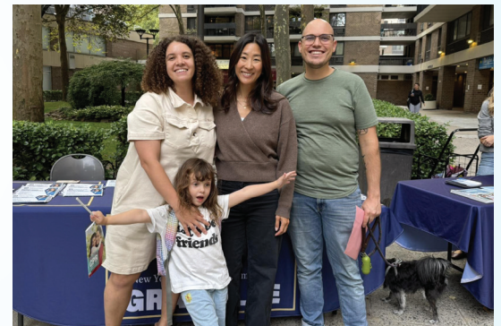
Reunidos con miembros comunitarios durante "Mobile Office Hours"