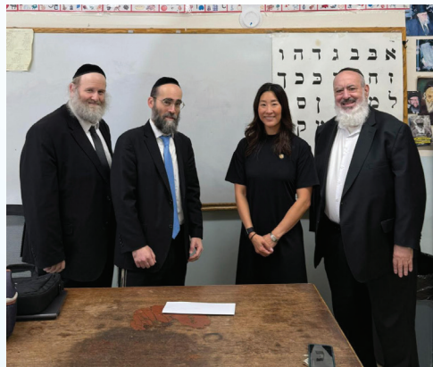
Reunión con Rabinos en Mesivtha Tifereth Jerusalem of America.