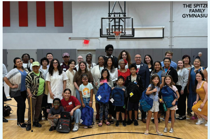
Repartiendo más de 1,000 mochilas gratuitas a familias en nuestro evento de regreso a clases, con Grand Street Settlement.

Respuestas de la trivial! 1. City Hall 2. The Chinatown Gateway 3. Economy Candy