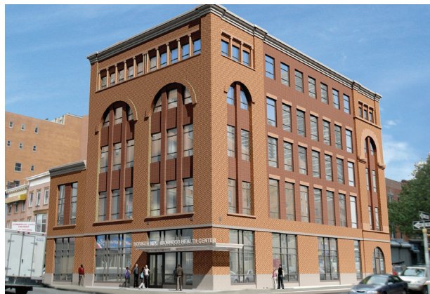
Centro de Salud de la Comunidad Boriken

Restauraciones al Medicaid: El presupuesto del Año Fiscal 2019-2020 ha reafirmado el compromiso de Nueva York al liderazgo en el acceso equitativo al cuidado de salud de alta calidad y asequible. El presupuesto restaura $641 millones en recortes al Medicaid, incluyendo el financiamiento para hospitales y centros de adultos de edad avanzada para responder a la tasa de aumento de 2 por ciento, y $34 millones en financiamiento para programas de salud pública. Las prioridades incluyen: