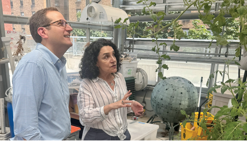
A principios de este año, visité el invernadero en la P.S. 333, una de las escuelas primarias más destacadas de mi distrito, a la que estuve encantado de apoyar este año.