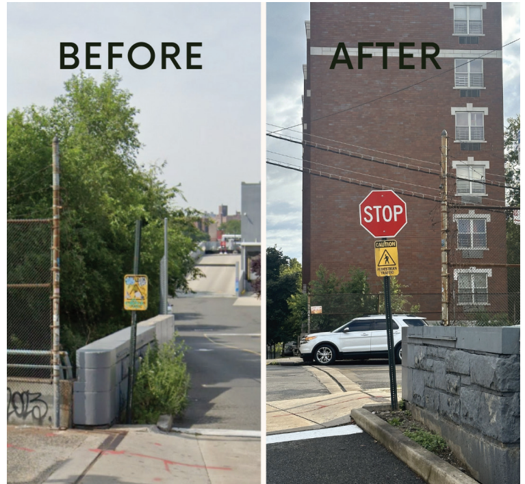
Before and After of the Stop Sign being replaced. El antes y el después de reemplazarse la señal de pare.

Nuestra oficina exitosamente facilitó el reemplazo de una crucial señal de pare que se había removido en una intersección muy transitada en la Calle 238 Oeste y la avenida Putnam, al lado de BJ's . Esta intersección ha tenido tránsito peatonal y vehicular significativo, y la señal de pare que faltaba representaba un riesgo de seguridad grave para la comunidad. Al trabajar rápidamente con oficiales de la ciudad, aseguramos la instalación de una nueva señal de pare, reforzando nuestro compromiso a mantener nuestras calles seguras, tanto para los conductores como para los peatones.