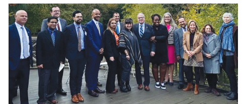
Attendees of the press conference at Van Cortlandt Park. Conferencia de prensa en Van Cortlandt Park.