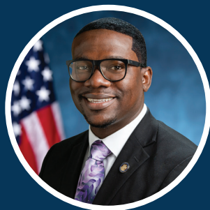
Asambleísta Demond L. Meeks

New York State Assembly • Albany, New York 12248